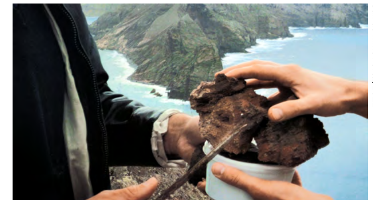
Still do filme Porta, 2022

Som estéreo, loop 17' Lançamento: Black Hole Time Warp, Lisboa